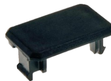
Szekunder takarólemez Rendelési szám: 53016