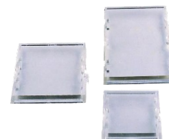
Plombalemez (megakadályozza a csatlakozókhoz való hozzáférést) Rendelési szám: 59041