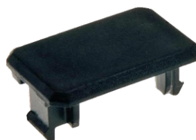
Szekunder takarólemez Rendelési szám: 53016